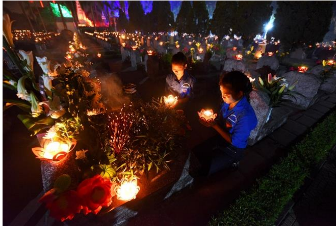
Đoàn viên thanh niên Thắp nến tri ân tại Nghĩa trang liệt sỹ Tp Hà Nội

Ngoài ra, Thành đoàn Hà Nội chủ trì tổ chức khám bệnh, phát thuốc miễn phí cho 1.000 người có công với cách mạng và người dân có hoàn cảnh khó tại xã Xuân Sơn, Sơn Tây và xã Tản Lĩnh, Ba Vì, Hà Nội với 1.500 cơ số thuốc; Đoàn khối các cơ quan Trung ương chủ trì tổ chức khám bệnh, phát thuốc miễn phí cho 300 người có công với cách mạng và người dân có hoàn cảnh khó tại phường Đông Ngạc và Đức Thắng, quận Bắc Từ Liêm, Hà Nội với hơn 300 cơ số thuốc.